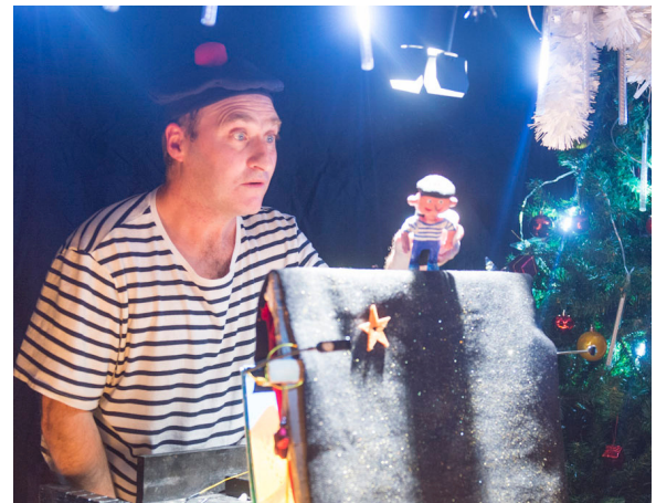
Fête de Nantes Nord